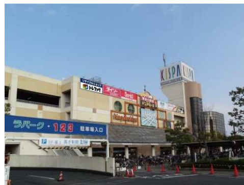
トレジャーファクトリー岸和田店 外観

住所 〒596-0006 大阪府岸和田市春木若松町21-1 ラパーク岸和田 2F 営業時間 平日・土祝 10:00～20:00 日曜日 9:00～20:00 アクセス 南海本線の春木駅から徒歩5分 ※共同駐車場(1,454台)あり