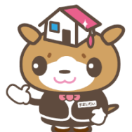
イメージキャラクター すまいりいちゃん

住所 : 〒372-0801 群馬県伊勢崎市宮子町3423-15 ベイシア伊勢崎 西部モール店 営業時間 : 10:00～20:00（年中無休） TEL : 0120-56-1015（ファースト行こう！！） HP : http://www.sumai-1st.jp