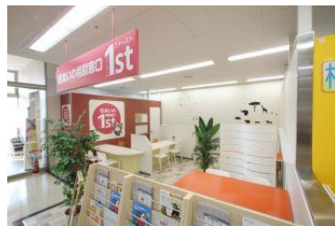
明るい雰囲気店内。対応は全て女性スタッフ。 お気軽にご相談ください！