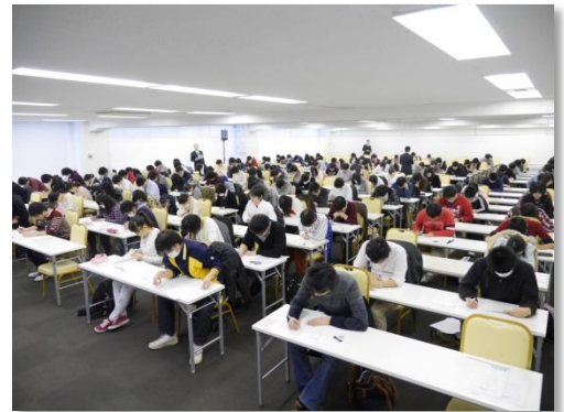
私立医系大志望校判定全国模試の様子

東京医進学院の私立医系大志望校判定全国模試は、当学院が医学部専門予備校として42年にわたり培ってきた豊富な入試情報、分析をもとに実施されます。スピーディーな答案返却、丁寧なアドバイス、的確な学力把握など、他に類のない特色を有している志望校判定模試を、医系大入試に向け、自分の力を試す機会としてご活用ください。