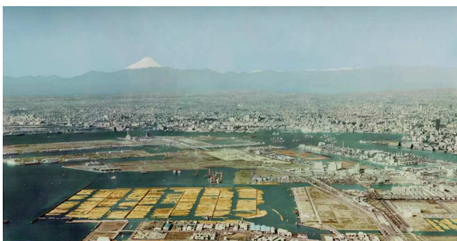
当時の新木場の貯木場の風景