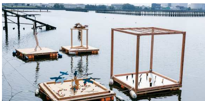
10月の木の日の様子「海の上にアート作品が並んだ」