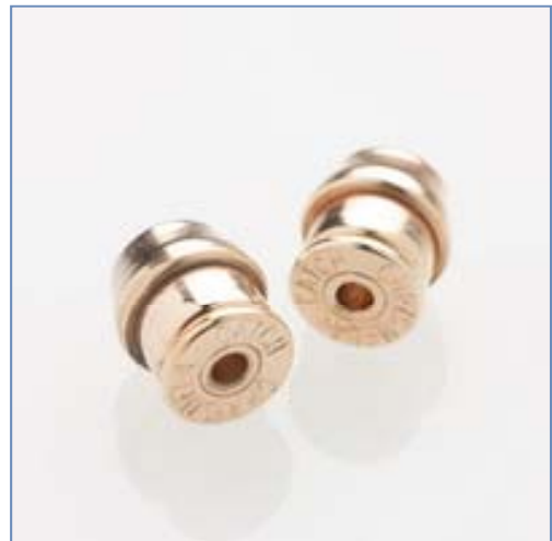
全長約5mmの内部は、0.01mmの誤差も許されない、9個の精密部品で構成させています。 特許第4167703号、特許第4560588号

「クリスメラキャッチ」は、0.6mm～1.1mmまでの太さのピアスに全て使え、保持力のテストでも8Kgの結果を出し、“外れにくい万能ピアスキャッチ”として、2008年8月販売を開始しました。