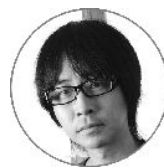
イラスト 漫画家 古屋兎丸