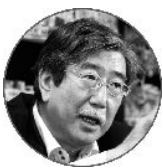
監修 防災・危機管理ジャーナリスト 渡辺実