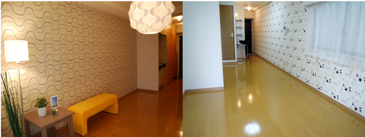
各部屋個性的な壁紙が続々施工中のロイヤルアネックス