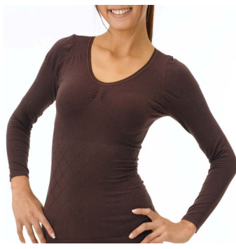
ホットモアスタイル シェイプアップインナー8分袖トップス