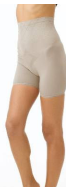
ホットモアスタイル シェイプアップインナー3分丈ボトム・8分丈ボトム