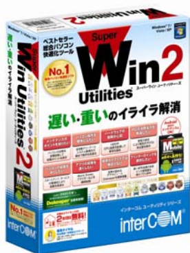
「SuperWin Utilities 2」パッケージ

また、初代よりこだわってきた“使いやすさ”を今回も継承しています。各機能の実行におすすめ設定を用意して、ユーザーは各機能の実行ボタンをクリックするだけで、迷わず安全にパソコンメンテナンスを行うことができます。