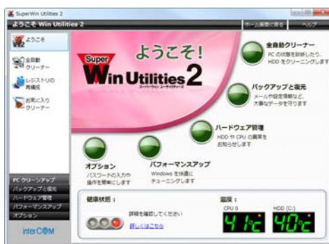
「SuperWin Utilities 2」メイン画面