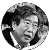
監修 防災・危機管理ジャーナリスト 渡辺実