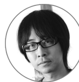
イラスト 漫画家 古屋兎丸