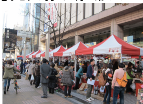
ハピマルシェ錦糸町 開催風景