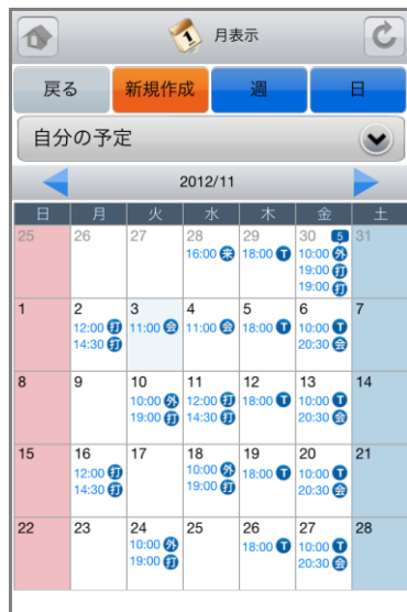
<スケジュール画面>