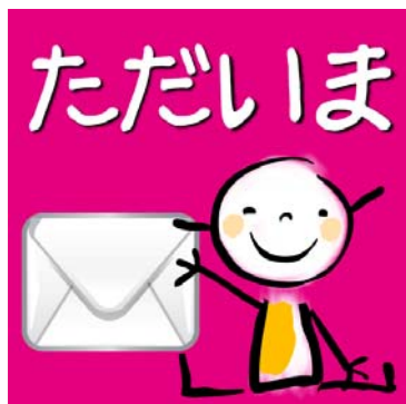
AppStore から無料でダウンロードできる

株式会社俊英館は、主婦向けアプリ開発プロジェクト「ママプリ」を電子創研と共同で実施。1月より数名の主婦と定期的に座談会を開催してきた。そこで出た意見やアイデアを元にした iPad アプリ「ただいま！～ママと僕の伝言板～」を6月5日(火)にリリース。AppStore から無料でダウンロードできる。