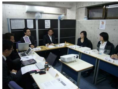
座談会で出たアイデアを元にアプリを開発