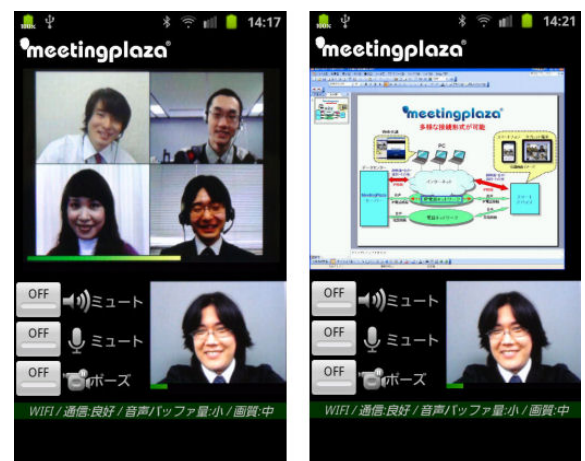
図1 Android 端末表示例

※ Android 端末の各機種につきましては事前の接続検証をお奨めしています。