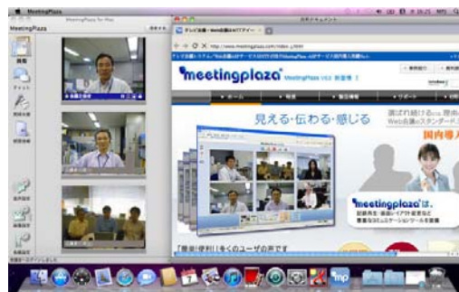
図 2 Mac 表示例