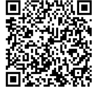
応募用 QR コード

ハガキの場合は、氏名、住所、電話番号をご記入のうえ、下記送付先にお送りいただけます。