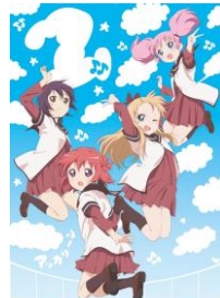
「ゆるゆり♪♪」 絶賛配信中