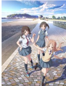
「TARI TARI」 絶賛配信中