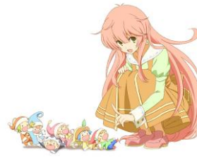
「人類は衰退しました」 絶賛配信中