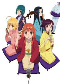
「じょしらく」 7/15 より配信開始