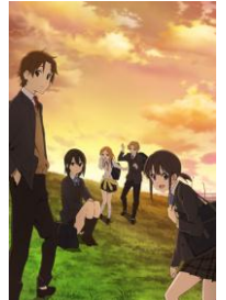
「ココロコネクト」 7/14 より配信開始