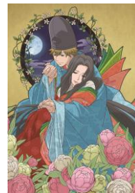
「超百人一首うた恋い。」 7/17 より配信開始