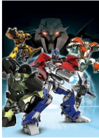
「超ロボット生命体トランスフォーマープライム」 絶賛配信中

スマホでアニメ見るならビデオマーケット！アニメ新番組を9本配信！ ビデオマーケット夏新番組アニメ見逃し配信ラインナップ発表！ 全て1話目無料！