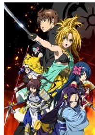
「織田信奈の野望」 7/16 より配信開始