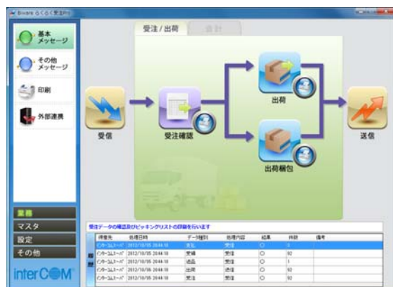
メイン画面(受注/出荷)

さらに、これまでの EDI ソフトの運用上の欠点とされていた、取引相手ごとに複数のシステムが必要だったのに対して、「Biware らくらく受注 Pro」では、一本のソフトウェアで複数取引先の一元管理が可能となっています。