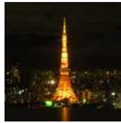
インドネシア人の 東京のイメージ