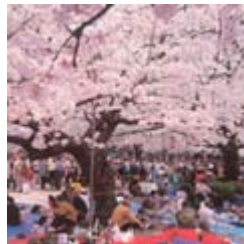
インドネシア人の 上野公園のイメージ