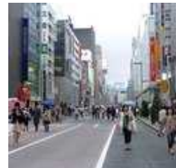
インドネシア人の 東京のイメージ