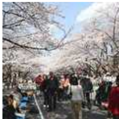
インドネシア人の 上野公園のイメージ

その調査の結果、行ってみたい観光地として“上野公園”が5位にランクインしたり、食べたいものとして“どら焼き”がランクインしたりするなど、インドネシア人の日本に対する意外な認知や意識が見えてきました。他にも、日本で買いたいおみやげや宿泊施設を選ぶ際のポイント、日本を知る為に参考にする媒体などを調査しています。