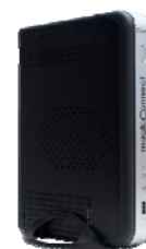
WOL コントローラ MC3000