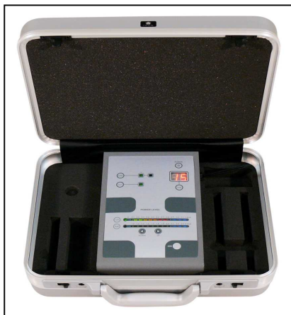
「スーパービタリオン」

フェイシャルで使用しても、前述の通り、高い出力で使用しても肌への刺激がない設計なので、シミやくすみ、ニキビ改善などの肌トラブルにおいて、従来器よりも高い改善効果を挙げることが可能です。なおインディバ・ジャパンでは、特許取得併用法に使用する、温熱を加えても壊れない特殊プロビタミンC「サーモスターチ」も販売しています。