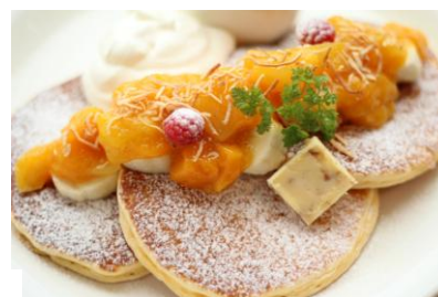
ロックアウェイ (Rockaway Beach)

★おすすめコーヒー:フリーダム(520円/ブラジル50%+ベースブレンド50%)