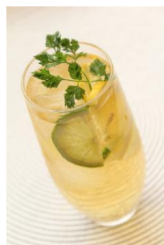
ドライジンジャー レモン&ライムソーダ