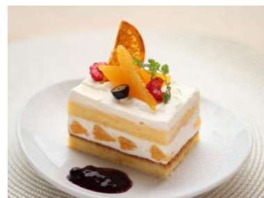
メガ・スター (季節のショートケーキ・Summer) (Shortcake)

★おすすめコーヒー:チェルシー(520円/ブラジル30%+タンザニア40%+ベースブレンド30%)