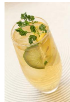
ドライジンジャー レモン&ライムソーダ (Dry Ginger Lemon & Lime Soda)

今回の新作「ドライジンジャーレモン&ライムソーダ」は、辛口のジンジャーエールを使い、夏のさわやかさ、清涼感を演出しています。