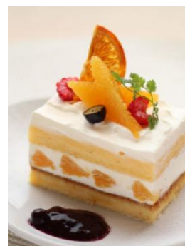
メガ・スター (季節のショートケーキ・Summer)