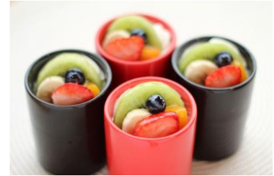
クッチーナプディング (CUCINA Pudding)

★おすすめコーヒー: クッチーナブレンド (470 円 / ベースブレンド 100%)