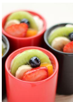
クッチーナブディング