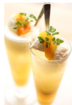
上)マンゴー・クリームソーダ 下)オレンジ・クリームソーダ