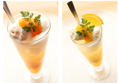
左) マンゴー・クリームソーダ (Mango Cream Soda) 右) オレンジ・クリームソーダ (Orange Cream Soda)

また、上記 2 品のほか、「コーヒーフロート」(650 円)も 6 月 3 日(月)よりご提供いたします。