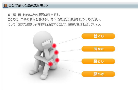
自分の痛みと治療法を知ろう