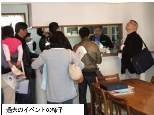
過去のイベントの様子