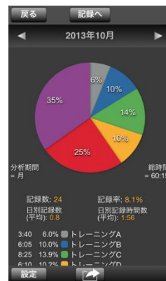
トレーニング種別