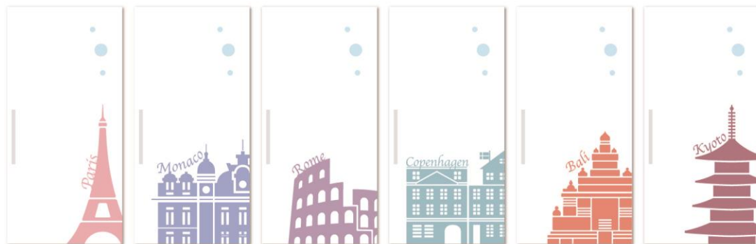
東京 モナコ ローマ コペンハーゲン バリ 京都