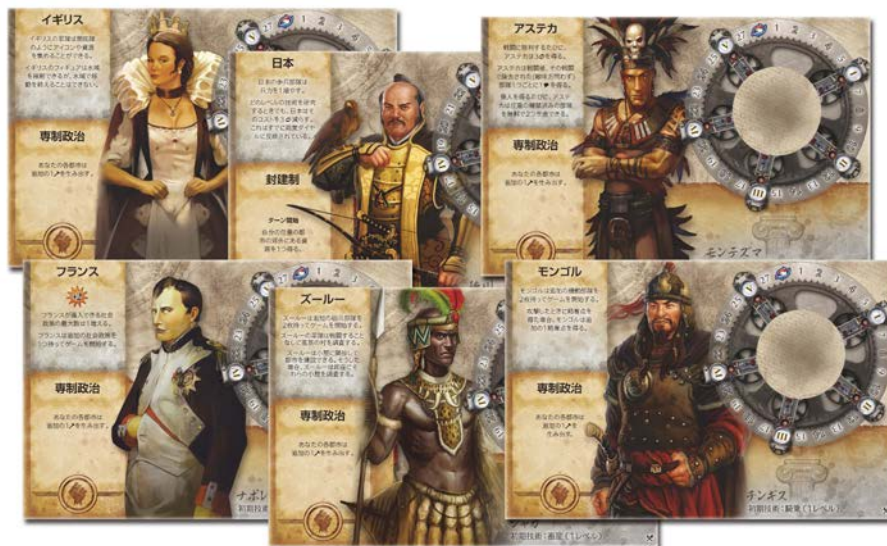
▲新たな文明：アステカ、イギリス、フランス、日本、モンゴル、ズールー