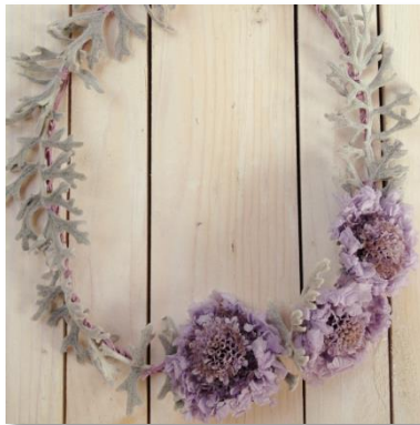
ダスティーミラー/花かんむり ¥ 10,900 (税込)