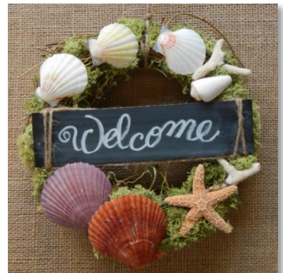
Shell/ウェルカムリリース ¥ 7,490 (税込)