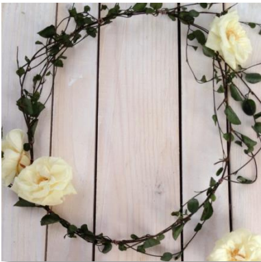
ラプンツェル/花かんむり ¥ 8,990 (税込)