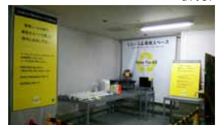
after 置き場の一角にリユース品専用スペースを設置