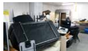
before サービス導入前の 粗大ゴミ置き場