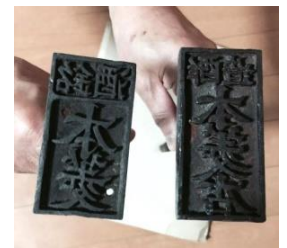
120年前当時、 実際に使われていた「本菱」の刻印