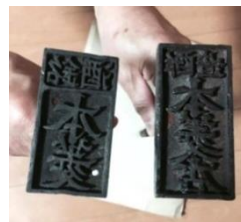
酒樽へ捺印するために 120年前実際に使われていた 「本菱」の刻印

今後月に1回、地元富士川町に町内外よりメンバーが集まり、2017年4月の「本菱」商品化に向けてセッションを重ねてまいります。次回セッションは富士川町の「大法師桜まつり」が開催される4月2日（土）を予定しており、酒作りの基礎となる水に関する勉強や、酒米の種類などのレクチャーをいたします。