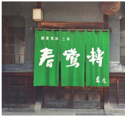
「本菱」復活プロジェクトの基地となる 寛政2年創業の萬屋醸造店さん