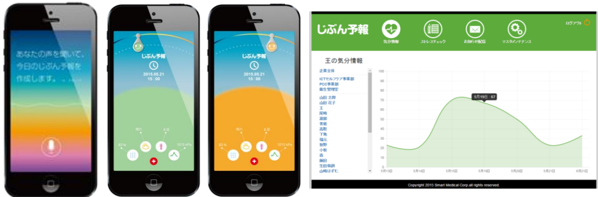
音声による日々の気分チェック

従業員に自らの気分状態を日常的に意識してもらうことにより、あらかじめストレスに対する心構えを形成し、セルフケアを助けることができます。