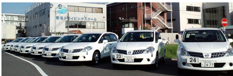
対象の教習所は菊名ドライビングスクールと、新鶴見ドライビングスクール

株式会社エフエムエス(本社：神奈川県平塚市、代表取締役社長：福澤正人)は、株式会社Tポイント・ジャパンが運営するTポイントプログラムの利用について締結し、2016年4月1日より、当社が運営する、菊名ドライビングスクールと新鶴見ドライビングスクールで、Tポイントサービスを開始いたします。