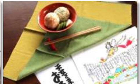
未病対策にもピッタリ！ はこじょ天女さまのおむすび弁当