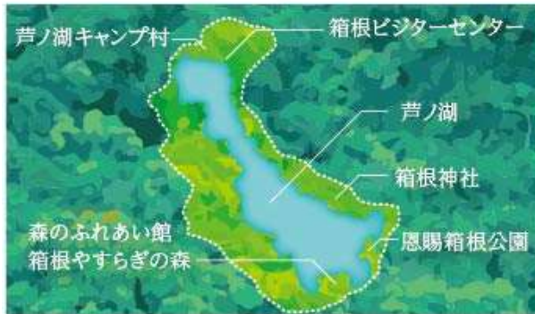
今回認定された「箱根芦ノ湖森林セラピー®基地」

「森林セラピー®ロード」とは、フィールド生理心理実験に基づき、専門家による科学的効果の検証がなされて認定された散策路を指します。森林セラピー®ロードは、主に緩い傾斜で構成されており、一般の歩道よりも道幅を広く取り、歩きやすさを考慮するなどの配慮がされたコースを中心に選定されています。