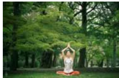
森の中の親子ヨガ（計3名のヨガ講師が出演）

総勢5バンドによる 野外ライブやベリーダンス講座、 パネルシアターなど親子で楽しめる イベント盛りだくさん！