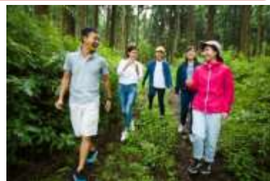
箱根の森の中のウォーキングツアー