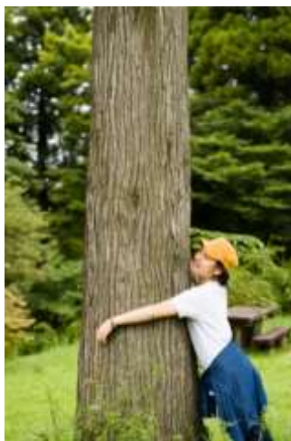
森林セラピストによる 森林セラピー体験イベント