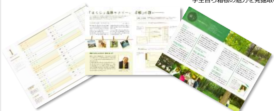
学生自ら箱根の魅力を発掘取材！

箱根の四季自然を網羅した、はこじょ完全オリジナルの女性のための“健康管理手帳”です。日々の体の変化を記録したり、箱根へ出かけるときお供に是非お持ちください。