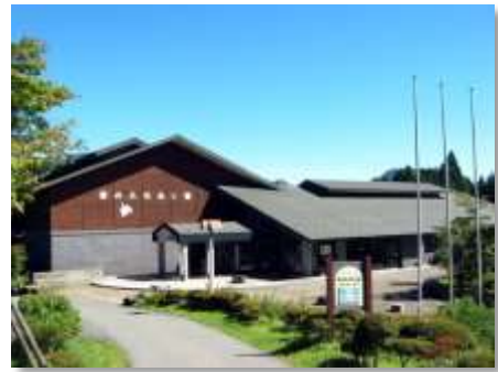
基地拠点「森のふれあい館」外観 https://www.hakone.or.jp/morifure/