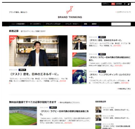
上図：サイトトップ画像