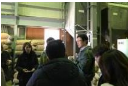
【精米についての説明】