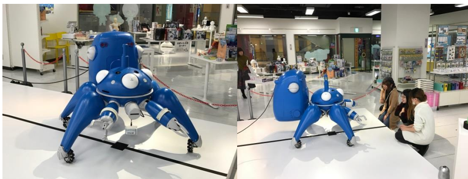
図1 リアルエージェント・タチコマ

エーアイでは、今回のプロジェクトにあたり、AITalk®による音声合成技術の協力をおこないました。アニメシリーズで「タチコマ」の声優を務める玉川紗己子さんの声を収録し、音声合成用のオリジナル音声辞書を作成したことにより、今回のプロジェクトで開発される「タチコマ」1/2スケールでもコミュニケーションロボット「リアルエージェント・タチコマ(図1)」ならびにiOS/Androidアプリ「バーチャルリアルエージェント・タチコマ(図2s)」の2機種にて自由な発話が可能になりました。