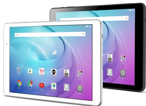
MediaPad T2 Pro ホワイト/チャコールブラック