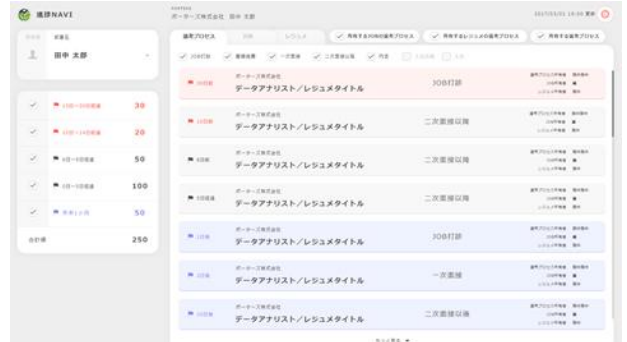
重要度の高い案件を自動的に上位表示