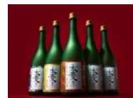
純米大吟醸・本菱