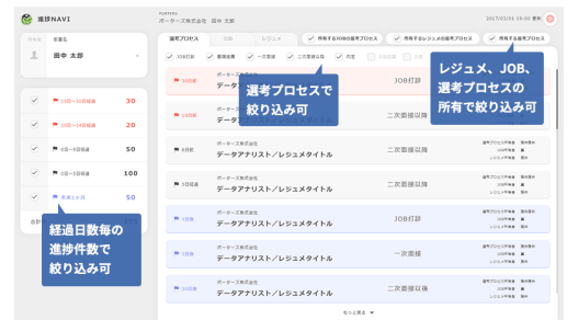
ホットな案件を上位表示する「進捗NAVI」