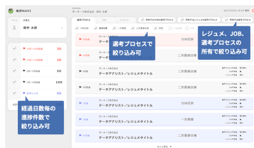
ホットな案件を上位表示する「進捗NAVI」