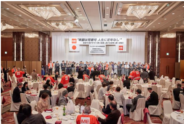
グランドフィナーレ

スタッフ同士の交流を楽しみに毎年ご夫婦で参加されているという派遣スタッフの方からは、「美味しいお食事や楽しい余興が毎年楽しみ。派遣スタッフが家族で参加できるイベントは大変珍しく、良い会社に出会えて良かった」という嬉しい感想も頂戴いたしました。本社社員の平均年齢も60歳を超えるマイスター-60では、今後とも高齢者の皆様の雇用を創出し、皆様がより一層生き生きと働ける社会の実現を目指して、サポートを強化してまいります。