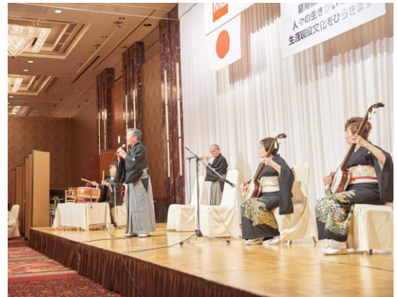
吾妻栄継による民謡

2019年3月23日（土）には、大阪で働く派遣スタッフの方々とその配偶者様を対象にした交歓会も開催予定です。