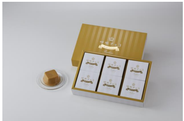
呼吸チョコ贅沢ムース<プラリネ味>