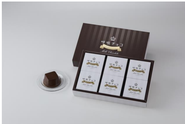
呼吸チョコ贅沢ムース<ミルクチョコ味>

この度、「呼吸チョコ」から新商品「呼吸チョコ贅沢ムース<ミルクチョコ味>」、「呼吸チョコ贅沢ムース<プラリネ味>」を発売いたします。