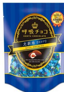
大阪みやげの新定番 「呼吸チョコ」

※尚、プレスリリースに掲載されている内容、製品価格、仕様、サービス、お問い合わせ先、その他の情報等は発表時点の情報となります。その後予告なく変更となる場合がございますので、ご了承ください。