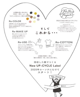
これから目指すところ