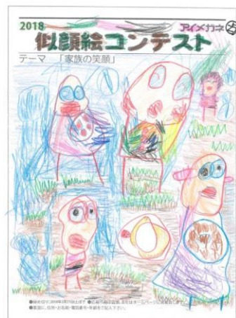
2018年グランプリ ちかまつ様