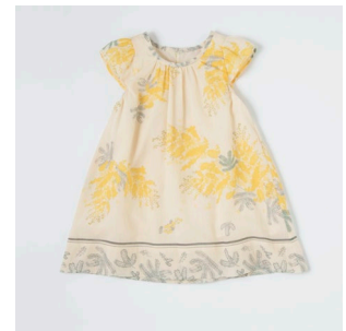
ミモザプリントワンピース 14,300円 (税込)