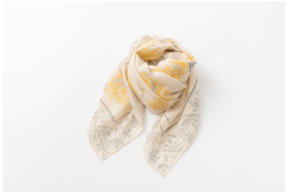
ミモザプリントスカーフ 19,800円 (税込)