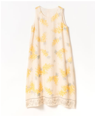
ミモザプリントワンピース 33,000円 (税込)