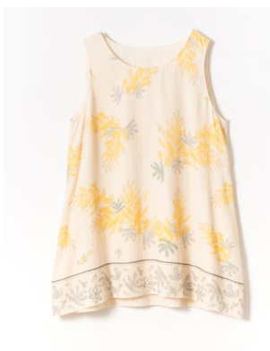
ミモザプリントチュニック 23,100円 (税込)