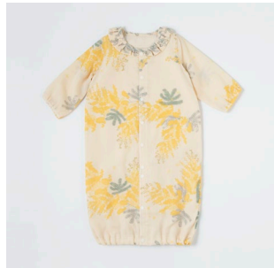
ミモザプリント2wayドレス 14,300円 (税込)

ミモザ柄の同じ生地で、ベビーのウェアもご用意しています。春を感じる柄なので、おでかけやギフトにもぴったり。赤ちゃんとママでおそろいコーデをおたのしみいただけます。