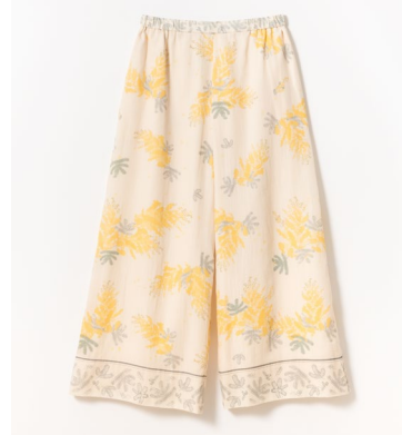
ミモザプリントパンツ 30,800円 (税込)