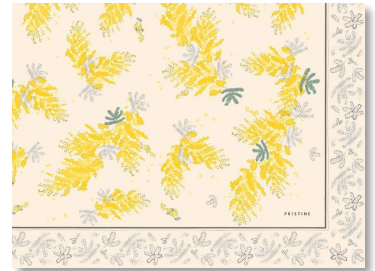
日本でミモザといえば、アカシアの小さな黄色の花で知られています。

3月8日は、1975年に女性の人権について考える日として国連が制定した「国際女性デー」。そして、のちにイタリアでは、この日に男性が女性へ敬意と感謝を込めて、母親や奥さん、会社の同僚などにミモザを贈る習慣ができました。愛と幸福を呼ぶと言われるミモザを贈られた女性たちは、そのミモザを誇らしげに飾り、仕事や家事からすこしだけ離れて、束の間の自由を楽しむのだそうです。このことから「ミモザの日」とも呼ばれるようになりました。