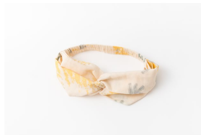
ミモザプリントターバン 3,300円 (税込)