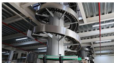
ベルトコンベアーを用いた最先端の自動包装技術を導入

独自の自動三次元倉庫システムを活用し、コードスキャンとトレーシングを全工程で実施しています。100%カスタマイズされたERP管理システムを使用することで、迅速かつ完璧に高品質の製品を供給することができます。