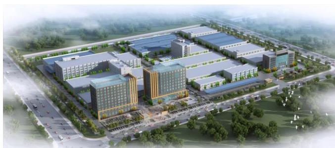
中国南通市の自社工場