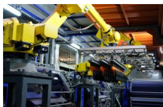
コーティング過程をロボット化し効率的で高品質な生産ラインを実現