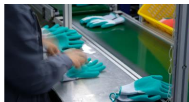
80人以上の品質管理の専門家が各工房から定期的にサンプルを選びテストしています。