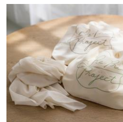
草木染めのストール（全6色）