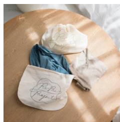
リプリバッグ（全5色）

(※1) リプリマーク：PRISTINEの考えるしあわせの循環「リプリ プロジェクト」をデザインしたオリジナルロゴマーク