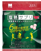
塩熱サプリ® スイカ味【新発売】