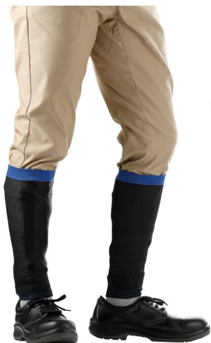
「カットガードすねカバーV」 着用イメージ